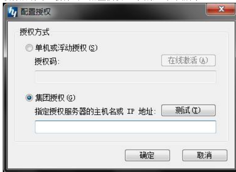
图“配置授权”对话框

在“配置授权”对话框选择集团授权，输入指定授权服务器的主机名或者 IP 地址，可以点击【测试(T)】按钮来测试授权是否成功，点击确定即可。