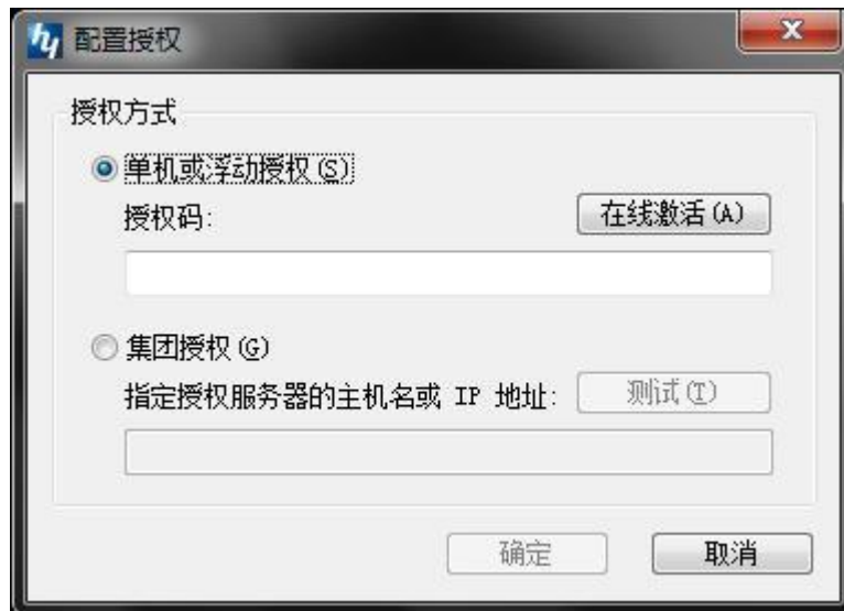
图“配置授权”对话框

在“配置授权”对话框选择“单机或者浮动授权”，填写正确的授权码，点击【在线激活(A)】按钮即可。